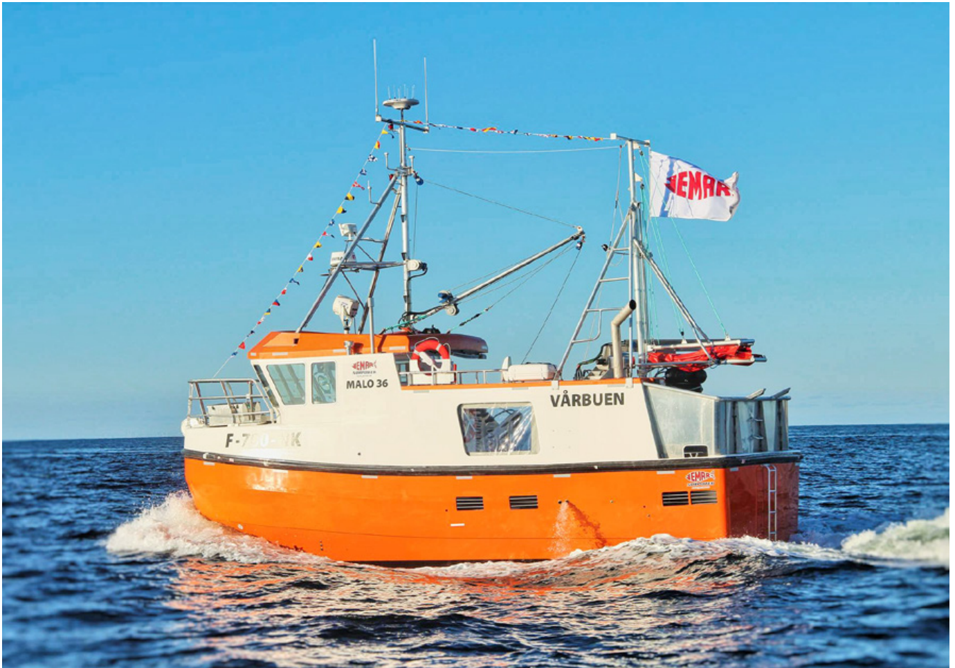
«Vårbuen» ble bygget i 2016 og måler 10,99 meter. Den er hjemmehørende i Honningsvåg og er en av de 87 båtene mellom 10,90 og 10,99 meter som er bygget etter 2015. «Vårbuen» har en bredde på 4,45 meter, som er litt over snittet for disse 87 båtene på 4,24 meter.

følge både innenfor bunnfiskeriene og pelagiske fiskerier. Samtidig er de blitt vakrere å se på. Lengde-bredde forholdet er økt fra 3:1 til over 4:1. De som valgte å forlenge er nå blitt cirka 10 meter lengre. De som valgte å bygge nytt har fått fartøy som er blitt bredere, lengre og med større motorkraft enn de fartøyene som ble forlenget.